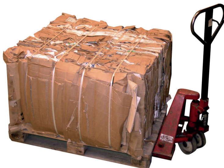
400 kg pappball på europall