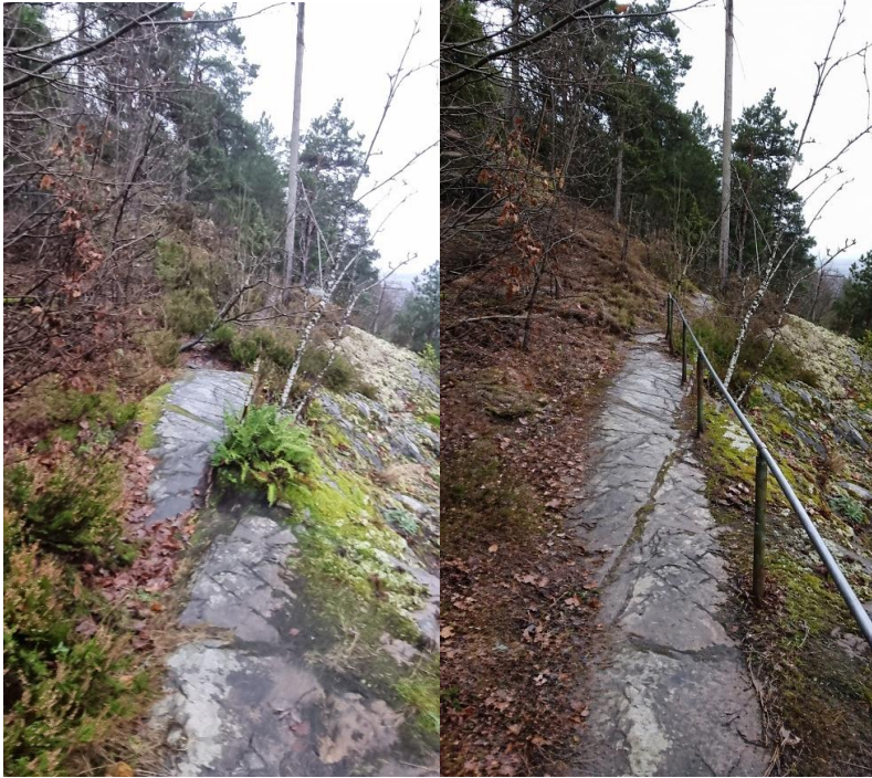
Bilde 5 og 6. Dagens kyststi på et glatt område i dag. KI-bilde til høyre illustrerer mulig sikringstiltak vi kan å få på plass i samarbeid med Nesodden kommunes parkavdeling (nr. 18 på Figur 3)