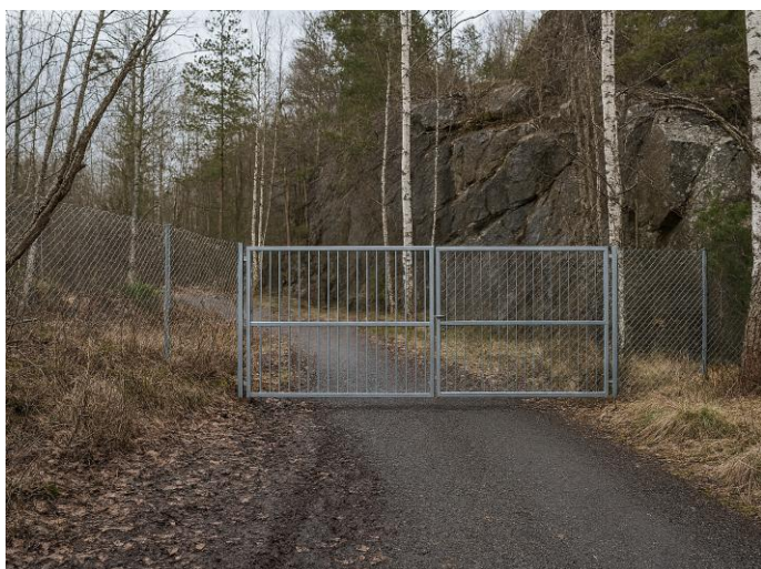
Figur 4. KI generert illustrasjon av port med gjerder for avstenging av anleggsveien mot kyststien.

Tiltaket er lokalisert slik at allmenn ferdsel langs kyststien kan opprettholdes uendret, samtidig som ferdsel inn i bruddområdet effektivt forhindres. Porten vurderes som et nødvendig og målrettet tiltak for å styre ferdsel og redusere risiko, og er nærmere angitt i vedlagt infrastrukturkart og illustrert med bilder av dagens situasjon.