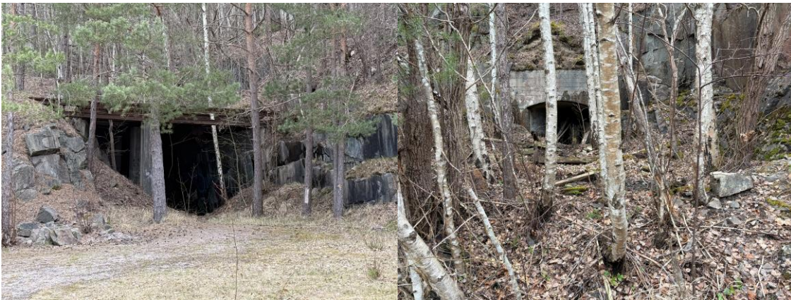
Bilde 7 og 8. Etterlatt infrastruktur og åpning like ved brygge og sjø langs kyststien. Det søkes om å få gjerdet inn alle disse hullene. (nr. 9 og nr. 11 på Figur 3).

Figur 3, også vist som utskriftsvennlig format i vedlegg 2, viser områder sikrings- og forbedringstiltak vi søker om.