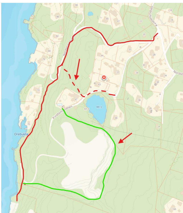
Figur 2. Rød strek viser dagens Kyststi – hovedferdselsåre. Grønn strek- omtrentlig plassering av eldre gjerde etablert da anlegget var i drift. Stiplet rød strek angir snarvei fra Kvistemyrveien som er noe skjult i dag, men som kan brukes som alternativ enn å gå gjennom usikret nedlagt industriområde.

Den etablerte og prioriterte ferdselsåren i området er kyststien (se figur 2), som inngår i den sammenhengende kyststien mellom Fjellstrand og Fagerstrand. Den er åpen for allmenn ferdsel og godt merket, og utgjør hovedlinjen for ferdsel i området. Kyststien følger Nordstrandveien ned mot sjøen og går videre langs sjøen gjennom tiltakshavers eiendom i retning Svestad brygge og det tidligere Shell-området.