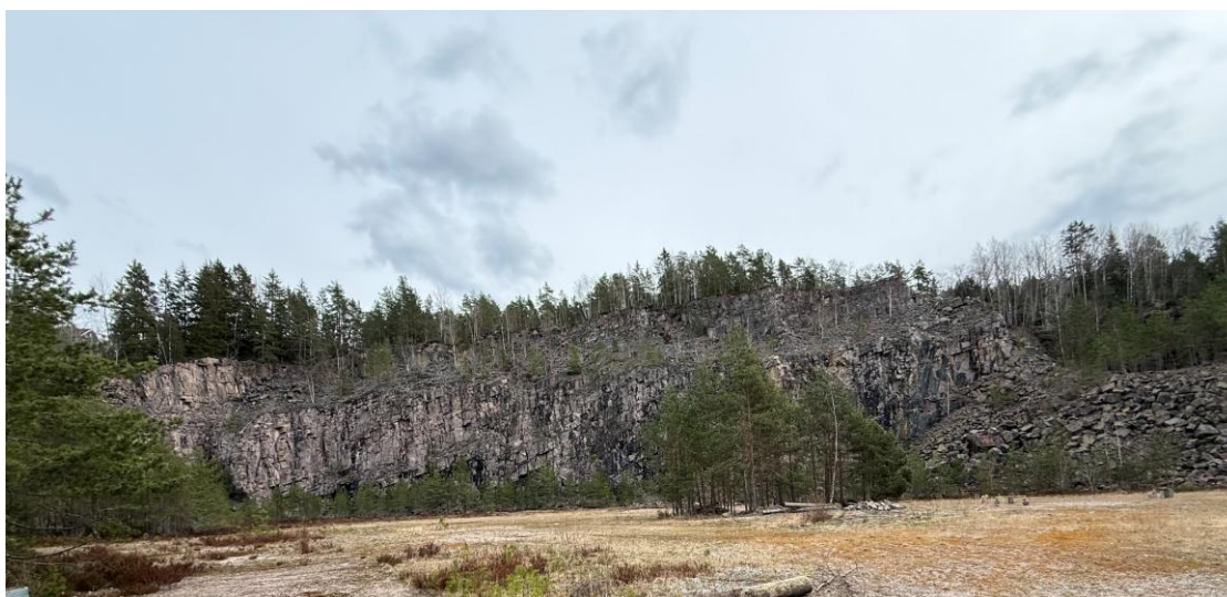
Bilde 1. Deler av bruddflaten av steinbruddet avbildet. Området utgjør omlag 10 daa, med vegger på tre sider. Bakveggen er inntil 25 meter høy. Det er mye løs stein i bakveggen og den er ikke sikret.

Området er ikke tilrettelagt for allmenn ferdsel og har ikke karakter av friluftsområde. Ferdsel som har forekommet inn i området skyldes tidligere mangelfull sikring og utilsiktet tilgjengelighet, ikke planlagt bruk. Risiko i området er knyttet til det nedlagte steinbruddet og tilhørende infrastruktur med utskipningstrasé, ikke til ferdsel som sådan. Bruddet har en bakvegg på opptil ca. 25 meter, løs stein i bruddkanten og det er rapportert om steinsprang.