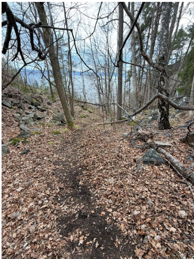
Bilde 9. Sti mellom kyststien i Nordstrandveien og Kvistemyrveien som er tilgjengelig alternativ til gjennom bruddet fra Kvistemyrveien.

Tiltakshaver legger til grunn at det også er viktig å ivareta brukere som kommer fra Kvistemyrveien. Dette kan gjøres ved å tydeliggjøre og øke synligheten av den eksisterende stien på tiltakshavers eiendom som leder fra Kvistemyrveien ned til kyststien.