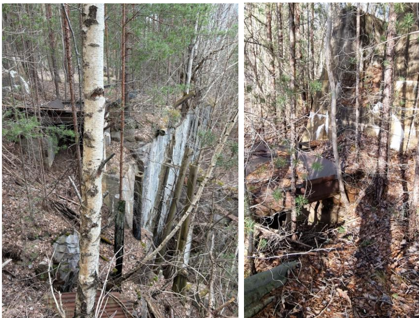
Bilde 2 og 3. Tippkanten med loddrett stup på 5-6 m og betong- og stålkonstruksjoner skjult mellom busker og trær.

Vedlegg 1 angir oversikt over brudd og nedlagt infrastruktur på eiendommen. Kombinasjonen av fysisk utforming, restinfrastruktur og tilgjengelighet gjør at området i sin nåværende form utgjør en risiko for liv og helse dersom ferdsel tillates gjennom industriområdet.