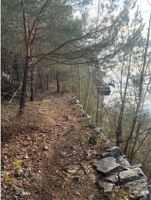
Bilde 4. Bilder fra partier på kyststi med behov for sikring (nr.16 på Figur 3)

Tiltakene er konsentrert om å bedre sikkerhet, fremkommelighet og tydelighet langs den etablerte hovedferdselsåren, og å redusere risiko for ferdsel inn i tilgrensende usikrede områder.